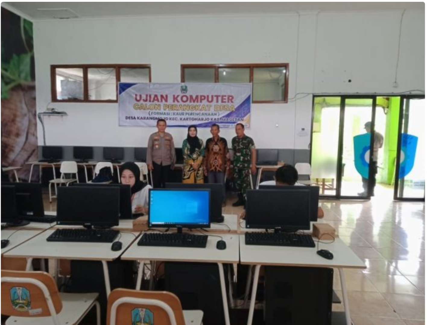
Danramil 0804/08 Barat Hadiri Penjaringan Ujian Praktek Komputer Calon Perangkat Desa Karangmojo

Magetan. – Komandan Koramil (Danramil) Tipe B 0804/08 Barat Kapten Inf