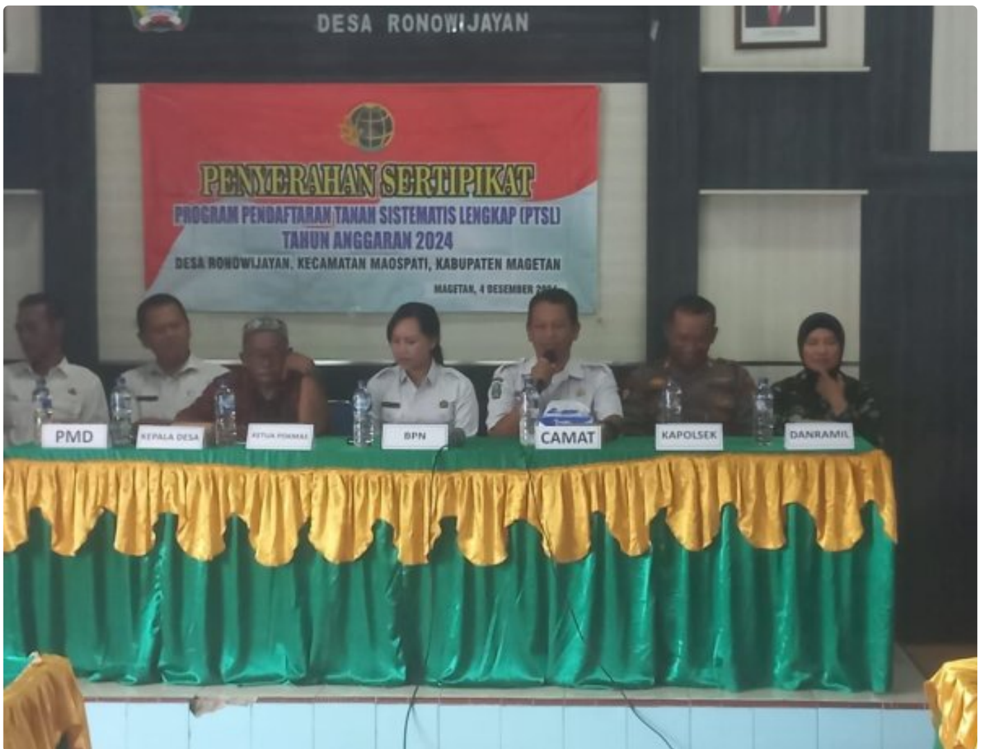
Danramil 0804/06 Maospati Hadiri Penyerahan Sertifikat PTSL Desa Ronowijayan

Magetan. - Bertempat di Balai Desa Ronowijayan, Kecamatan maospati,