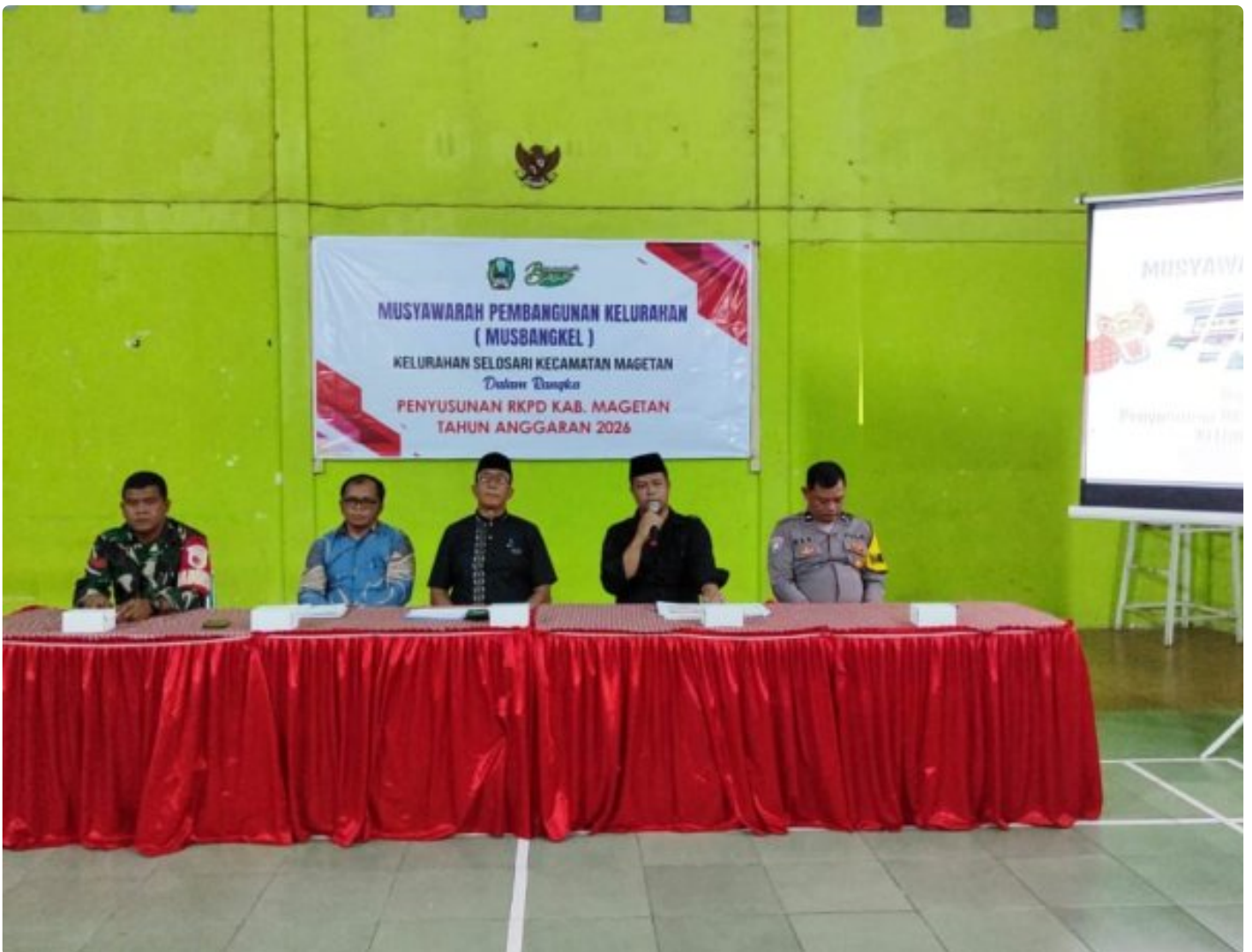
Babinsa Koramil 0804/01 Magetan Hadiri Musyawarah Pembangunan Kelurahan (MUSBANGKEL)

Magetan. - Babinsa kelurahan Selosari Koramil Tipe B 0804/01 Magetan jajaran